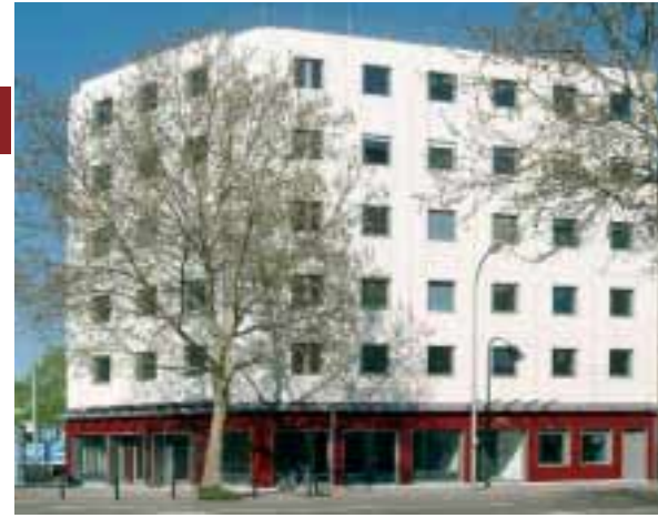
Das Enddarmzentrum in Mannheim.

Den Abschluß bildete ein Blick auf die Neuigkeiten aus dem Forschungslabor (U. Böcker, II. Medizinische Klinik Gastroenterologie; Universitätsklinikum Mannheim). Während bei der Klärung der Pathogenese mit der Identifizierung von Umweltfaktoren sowie Immunologischen Faktoren teilweise bereits Ansätze für therapeutische Konsequenzen realisiert werden konnten, steht dies bei den genetischen Faktoren im wesentlichen noch aus. Hier lassen sich eventuell Fortschritte anhand von neuentwickelten, speziellen Tiermodellen gewinnen. Auch in der Diagnostik und hier vor allem in der Detektion von Malignomen könnte neben sich weiter etablierenden konventionellen Verfahren, wie der Chromoendoskopie, auch der Einsatz molekularbiologischer Techniken anhand der Analyse von peripherem Blut, Biopsien und Faeces an Bedeutung gewinnen. Und nicht zuletzt ist natürlich die Aussicht auf the-