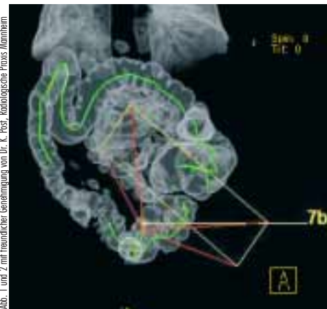
Abb. 2 Virtuelles Kolon: Übersichtsbild

Ein anorektaler Befall (Fissuren, Aphthen, Abszesse, Strikturen und Fisteln) bei Crohn-Patienten, der in 30 bis 40 Prozent der Fälle vorkommt und in zehn Prozent die Erstmanifestation darstellt, erfordert auch eine Therapie des oberen Gastrointestinaltraktes (H. Krammer; II. Medizinische Klinik Gastroenterologie; Universitätsklinikum Mannheim). In jedem Falle sollte bei atypischer perianaler Fistel (extrasphinkitär oder suprasphinkitär) auf einen Morbus Crohn untersucht werden. Problematisch ist hierbei die hohe Morbidität durch Sepsis und Sphinkterdestruktion mit resultierender Inkontinenz. Als konservative Therapie kommt neben lokalen allgemeinen Maßnahmen wie entsprechender analer Hygiene und Sitzbädern auch die lokale (Schäume, Suppositorien oder